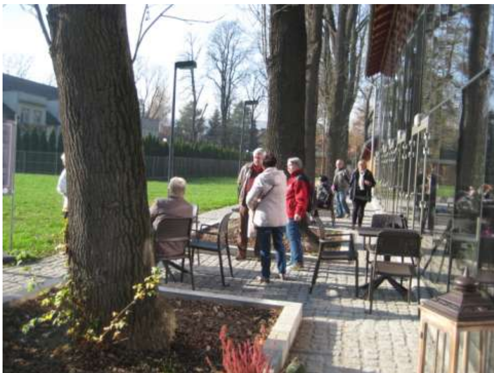
Zbiórka uczestników przed Muzeum Historii Fotografii