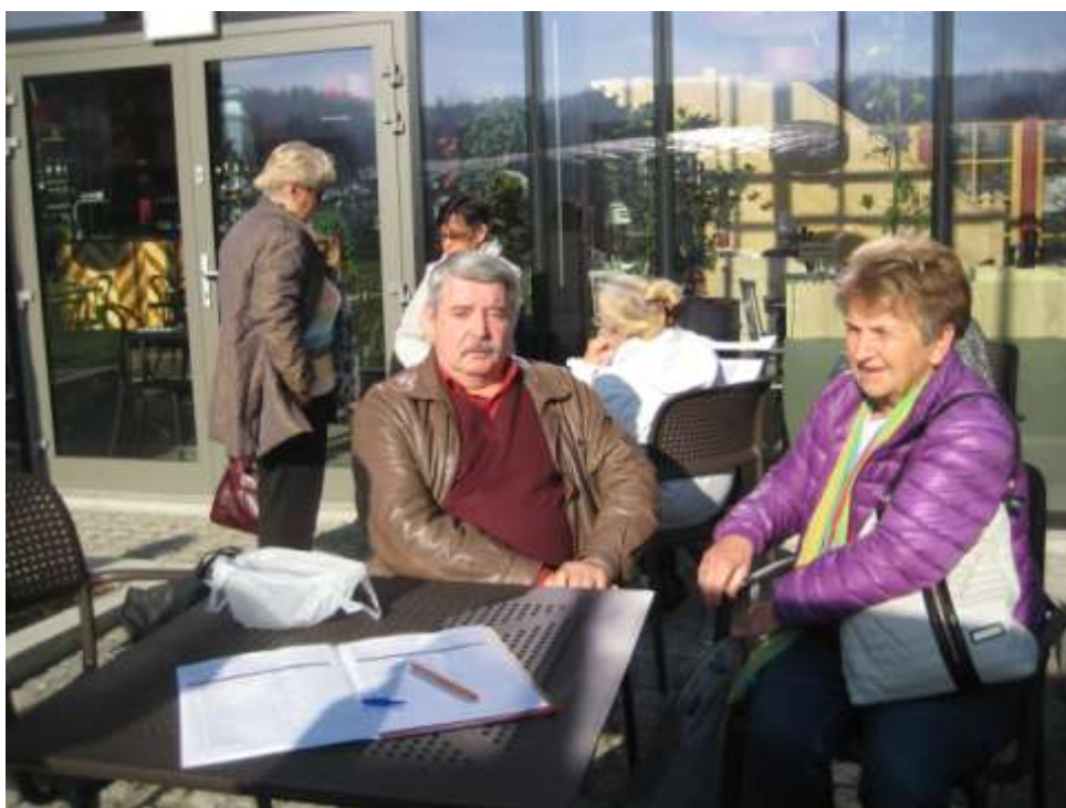
Czekamy jeszcze na spóźnialskich