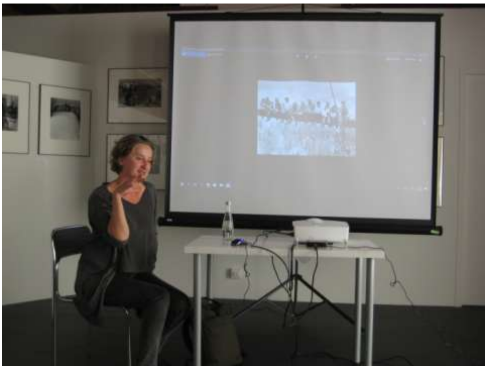
Fotografia prasowa przedstawiała nie tylko wielkie wydarzenia, ale także zwyczajne ludzkie problemy powszedniego dnia