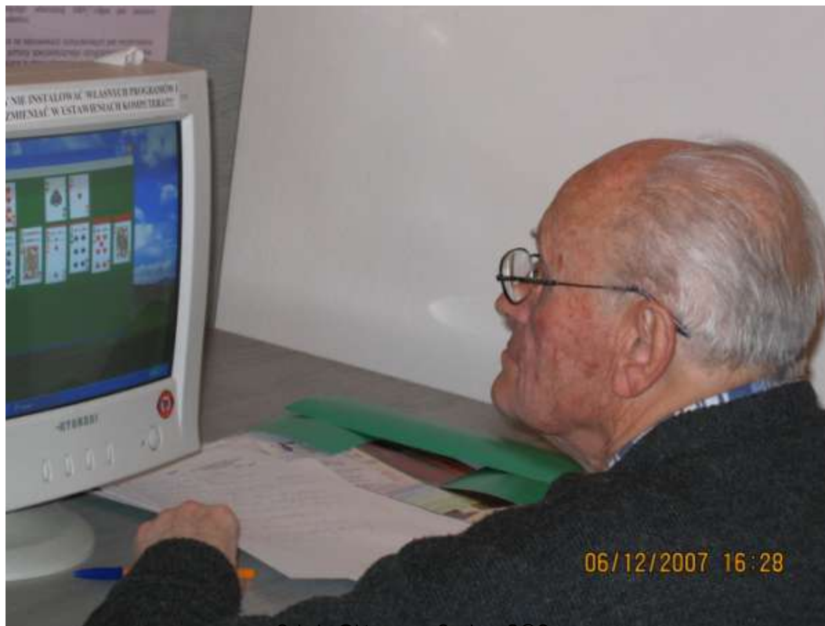
Szkoła @ktywnego Seniora-S@S